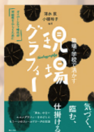
『職場・学校で活かす現場グラフィー』明石書店

http://www.fao.org/giahs/event-giahs-ecosystem-restoration